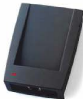
Z-2 USB MF